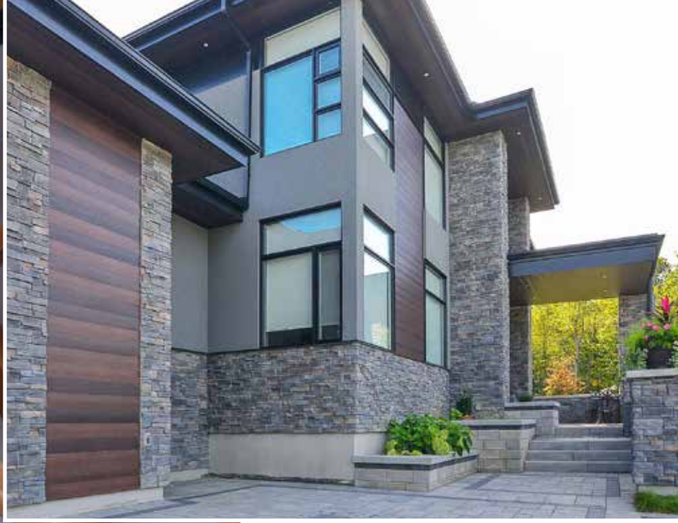
De l'ordinaire au spectaculaire, grâce à Great Lakes, tant à l'intérieur qu'à l'extérieur.